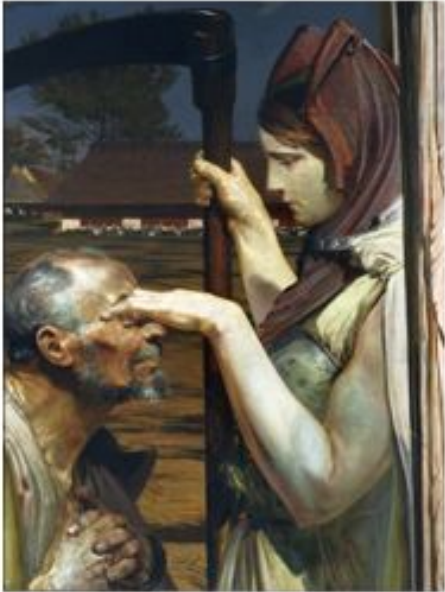
Jacek Malczewski, Śmierć (1902)

Lęk przed nazwaniem po imieniu śmierci jako zjawiska budzącego grozę doprowadził do zaginięcia jej pierwotnej starogreckiej nazwy, która etymologicznie była spokrewniona z nazwą łacińską ( mors, mort-is ) i słowiańską *sъ-mrǫtь , z czego polskie śmierć . Została ona zastąpiona wyrazem thanatos o pierwotnym znaczeniu ‘zniknięcie, zgaśnięcie’.